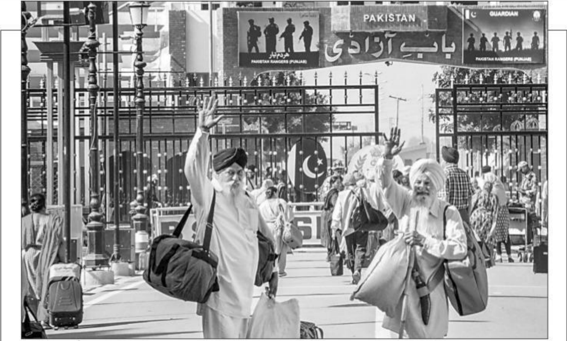
आस्था अमृतसर से मंगलवार को वाघा-अटारी सीमा की ओर जाते श्रद्धालु सिख।

जनसत्ता ब्यूरो नई दिल्ली, 5 नवंबर। करतारपुर गलियारे के उद्घाटन से पहले भारत से बड़ी संख्या में सिखों ने पाकिस्तान स्थित करतारपुर साहिब गुरुद्वारे के दर्शन किए और इस तीर्थ स्थल में सोने की एक पालकी स्थापित की। ननकाना साहिब में गुरु नानक देव की 550वीं जयंती समारोह में शामिल होने पाकिस्तान गए 1100 सिखों में से ज्यादातर ने गुरुद्वारा दरबार साहिब करतारपुर की यात्रा की, जिसे करतारपुर साहिब के नाम से जाना जाता है। उनके साथ पाकिस्तान के पंजाब प्रांत के राज्यपाल चौधरी सरवर भी मौजूद थे। इन तीर्थयात्रियों ने गुरुद्वारे में अपने साथ लाई गई सोने की पालकी स्थापित की। गुरु नानक देव की 550वीं जयंती 12 नवंबर को है।